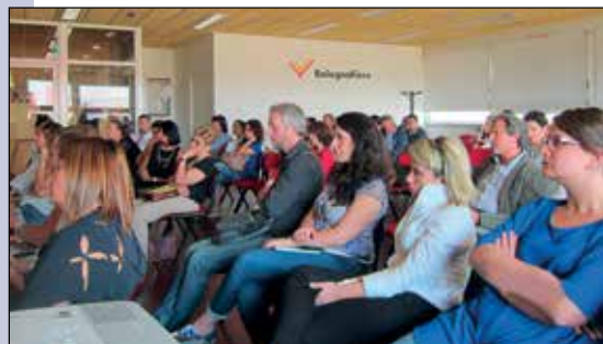
Il pubblico che ha seguito gli appuntamenti organizzati da Cosmetica Italia - Gruppo Cosmetici Erboristeria