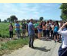
Visita a coltivazioni di specie officinali