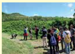
Uscita didattica sui Colli Euganei (Padova)