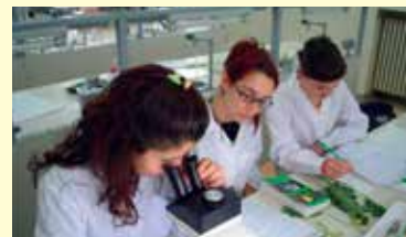
Esercitazione nel Laboratorio di Botanica Farmaceutica