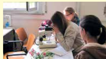
Studenti in laboratorio