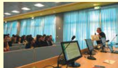
Un momento di un seminario