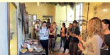
Visita all'Aboca Museum, Sansepolcro