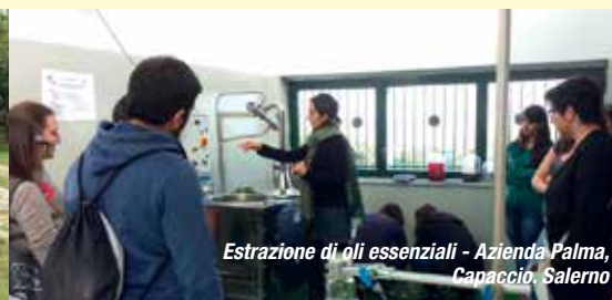
Estrazione di oli essenziali - Azienda Palma, Capaccio, Salerno