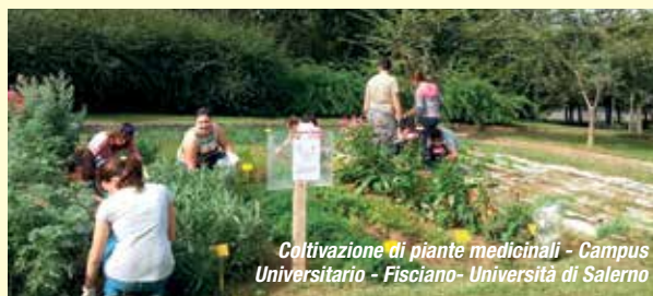
Coltivazione di piante medicinali - Campus Universitario - Fisciano- Università di Salerno