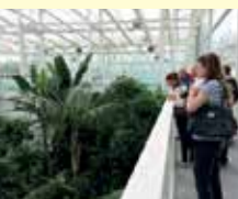
Visita alle nuove serre dell'Orto Botanico di Padova