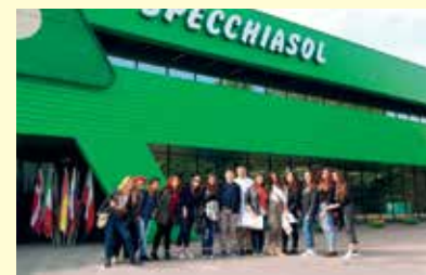
La visita all'azienda Specchiasol

Il laureato in Scienze Erboristiche può proseguire gli studi nel corso di Laurea Magistrale in "Scienze e Tecnologie Agrarie", classe LM69, presso la Facoltà di Agraria dell'Ateneo Federico II, con dispensa per 180 CFU.