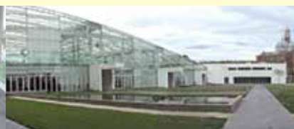
Le nuove serre dell'Orto Botanico di Padova