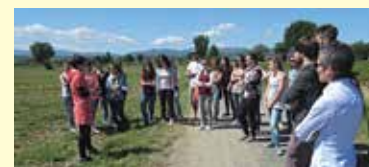
Visita a coltivazioni di specie officinali