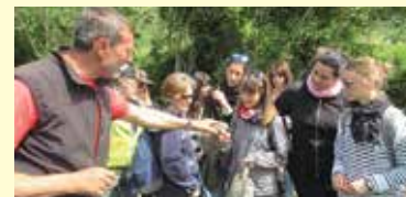
Uscita didattica sui Colli Euganei (Padova)