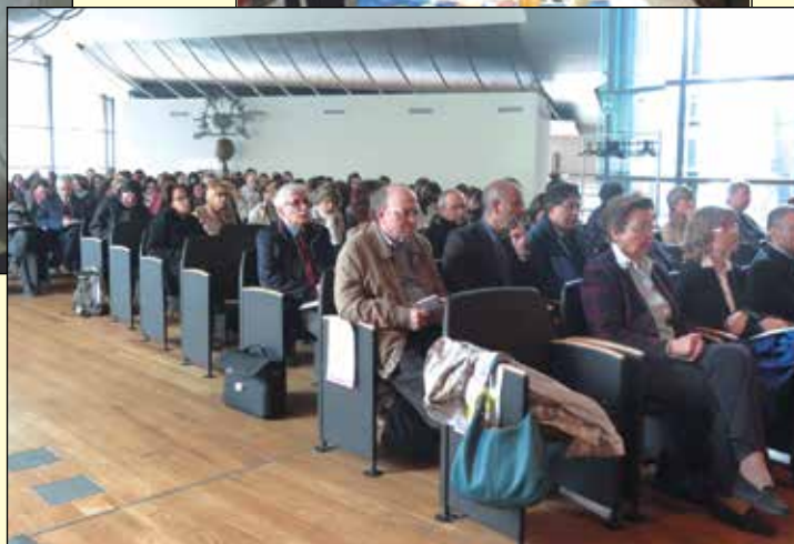
Il pubblico durante una tavola rotonda