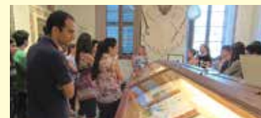
Visita all'Aboca Museum, Sansepolcro