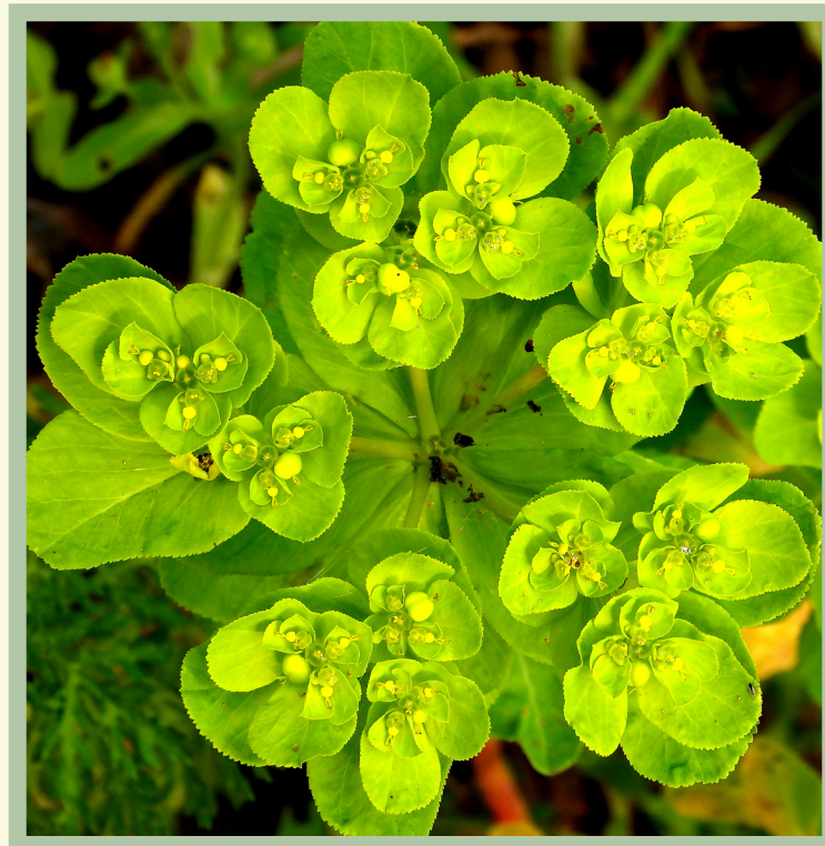
Ombrella a cinque raggi