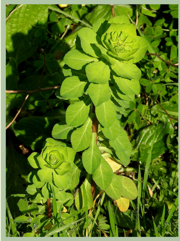
Disposizione delle foglie a spirale.