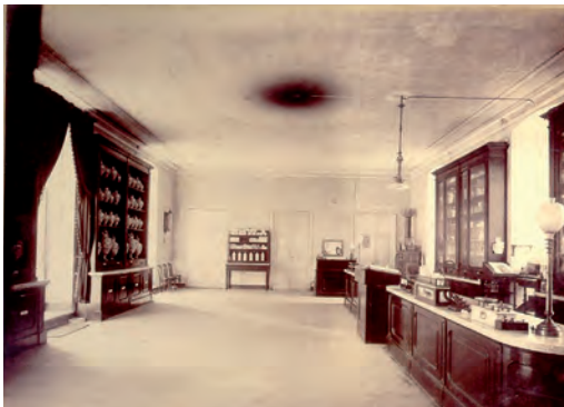
Una "moderna" farmacia del XIX secolo.