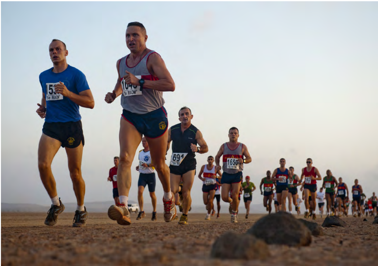
Gli sport ultra-endurance costituiscono un contesto naturale di stress estremo per il tratto gastrointestinale.

ta da parte dell'esercizio segue una curva non lineare: