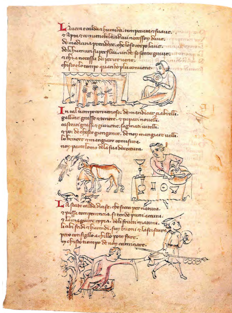
Pagina del Regimen Sanitatis (Ms. del XIV sec., Bibl. Naz. Napoli).

Si ignora quando nacque esattamente la Scuola ma è certo che essa fu la più antica istituzione dell'Europa occidentale per l'insegnamento della medicina e delle arti ad essa affini e, cosa assai importante per il futuro della scienza europea, fu il primo esempio di sincretismo tra il pensiero scientifico occidentale di origini greco-latine e quello orientale.