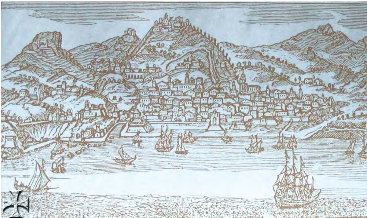
Grazie alla posizione geografica, alle sue relazioni con la vicina Sicilia, i rapporti intensi con l'Oriente anche più lontano, Salerno divenne un vero e proprio centro di organizzazione della vita culturale dell'epoca.