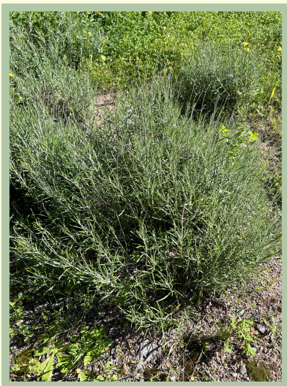
Portamento della specie.