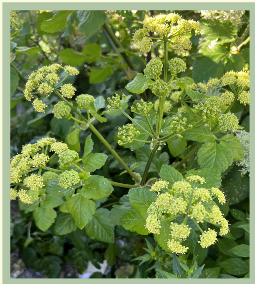
Portamento della specie.